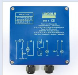
EOT1 – EOS Controller

Aussi, la fréquence de lubrification sera choisie en fonction des conditions d'installation et du degré d'encrassement des chaînes.